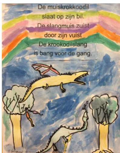
Vos Emmens (7 jaar) Klas N

Ik houd van een taartje en kijk graag Belgische politseries.